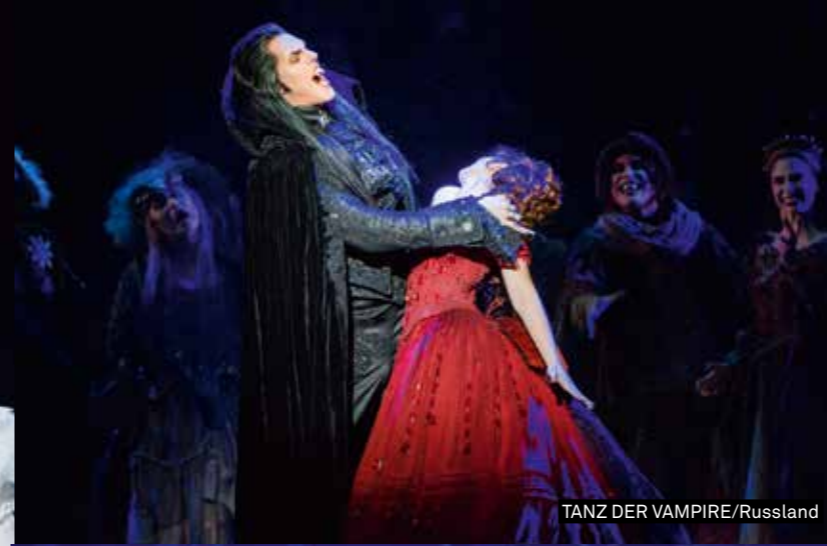
TANZ DER VAMPIRE/Russland