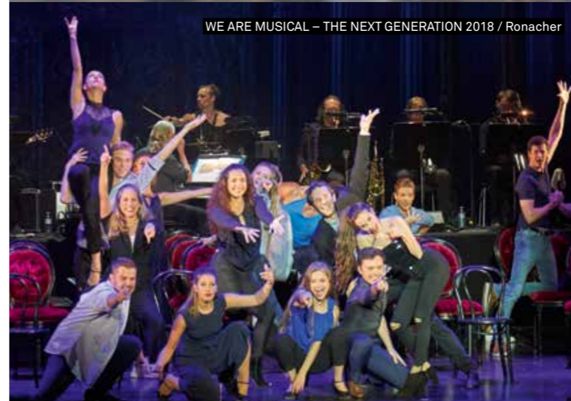
WE ARE MUSICAL – THE NEXT GENERATION 2018 / Ronacher