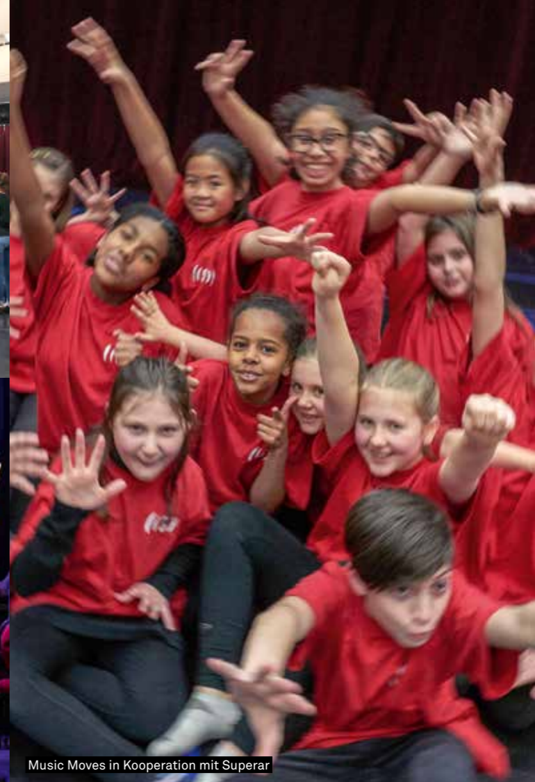
Music Moves in Kooperation mit Superar