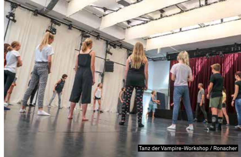
Tanz der Vampire-Workshop / Ronacher