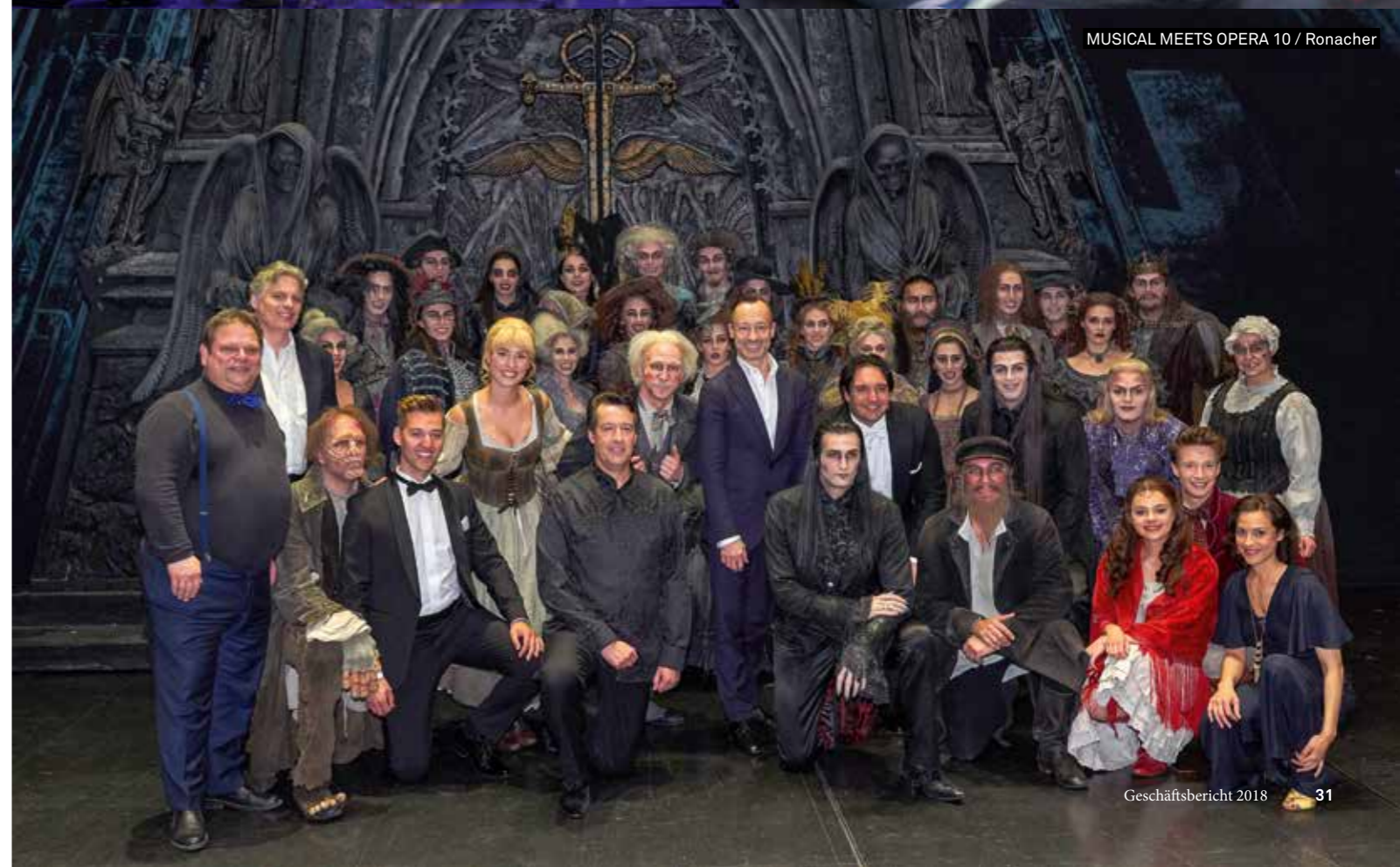
MUSICAL MEETS OPERA 10 / Ronacher