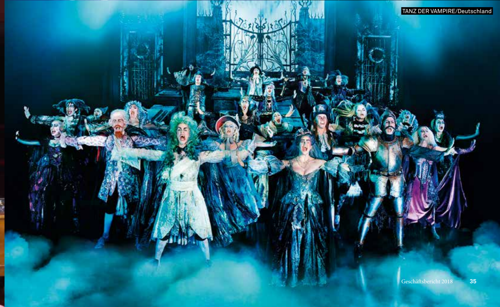
TANZ DER VAMPIRE/Deutschland