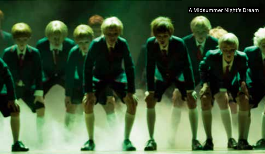
A Midsummer Night's Dream