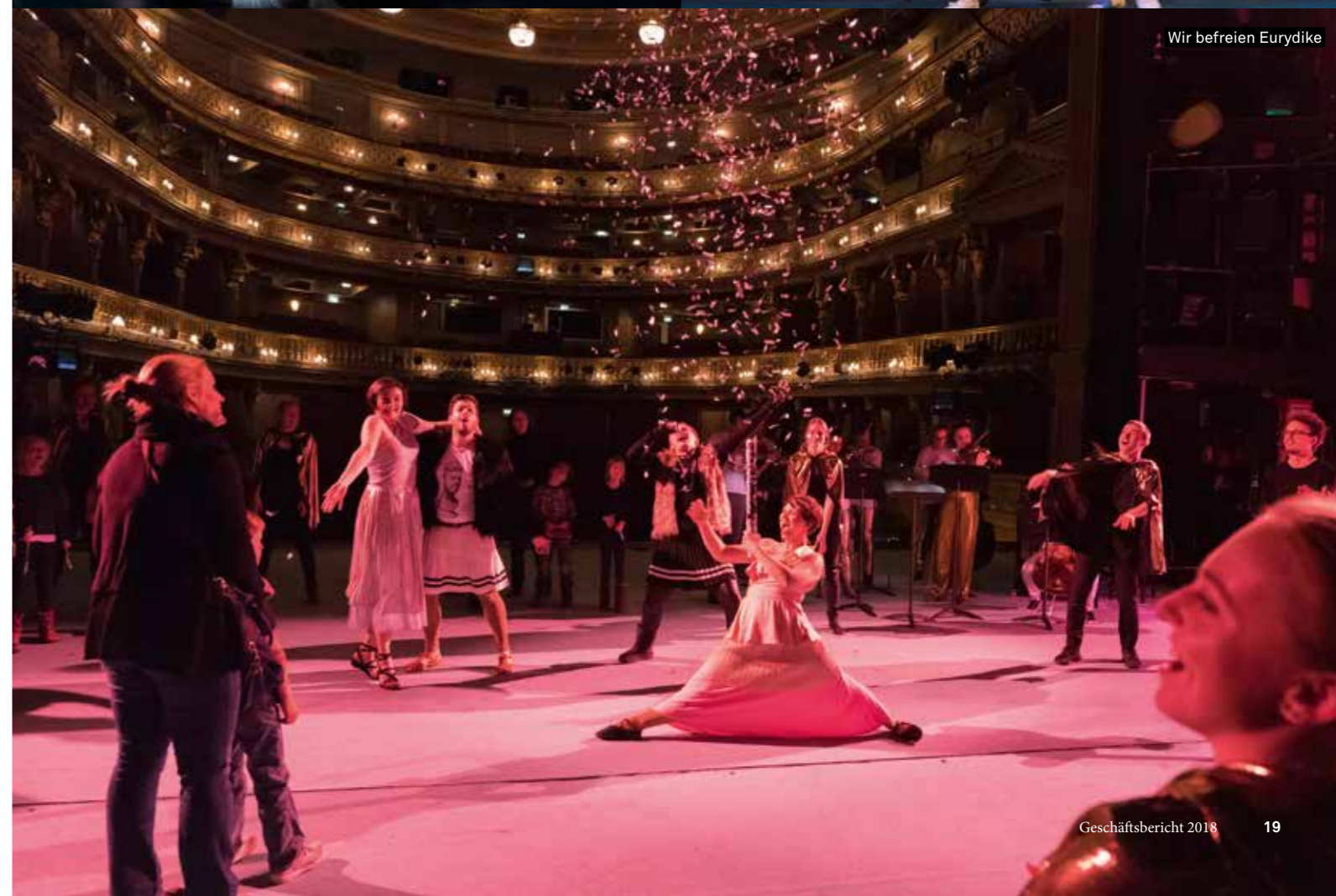
Wir befreien Eurydike