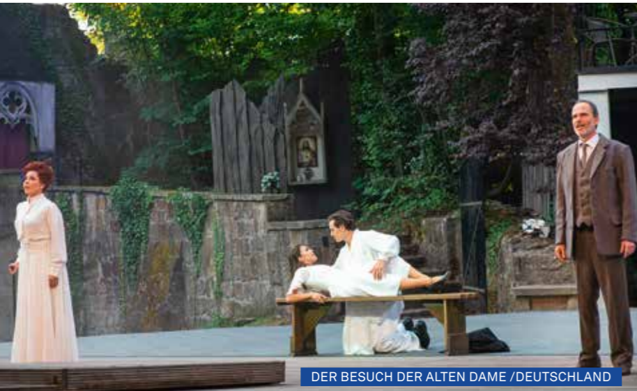
DER BESUCH DER ALTEN DAME / DEUTSCHLAND