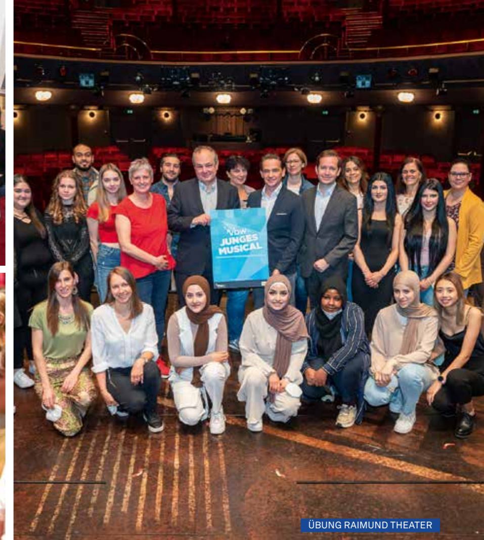
ÜBUNG RAIMUND THEATER