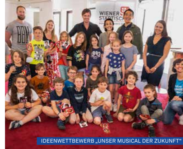
IDEENWETTBEWERB „UNSER MUSICAL DER ZUKUNFT“