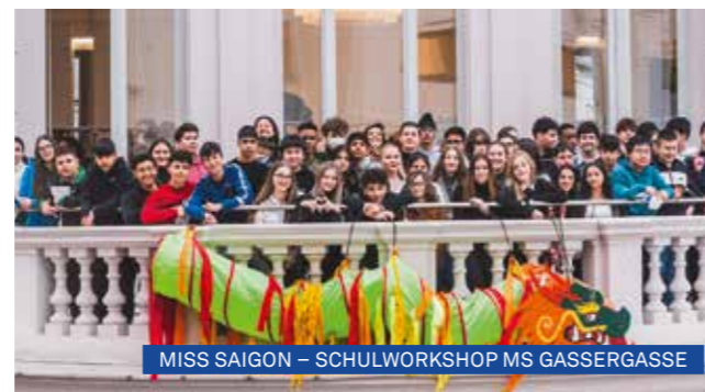
MISS SAIGON – SCHULWORKSHOP MS GASSERGASSE

materialien für Pädagog*innen ein abwechslungsreiches Online-Angebot. VBW JUNGES MUSICAL schafft unter dem Motto „Erfahren, Erleben, Mitmachen“ einen Spielraum zwischen Bühne und Publikum.