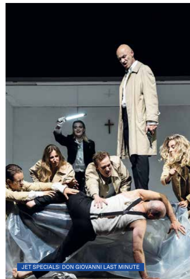
JET SPECIALS: DON GIOVANNI LAST MINUTE