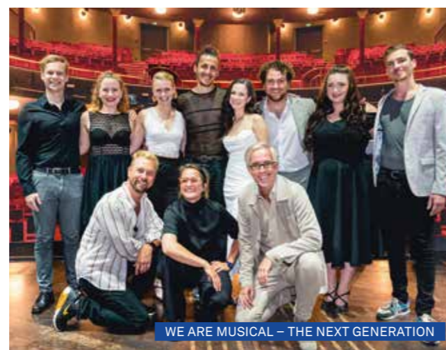
WE ARE MUSICAL – THE NEXT GENERATION

Bereits zum vierten Mal fand das eigens entwickelte und gemeinsam ins Leben gerufene Konzert von MUK und VBW ganz unter dem Zeichen der Nachwuchsförderung statt. Studierende des Studiengangs „Musikalisches Unterhaltungstheater“ standen gemeinsam mit den Stargästen und ehemaligen MUK-Alumni auf der Bühne des Raimund Theater und präsentierten einen abwechslungsreichen Querschnitt aus dem Genre Musical.