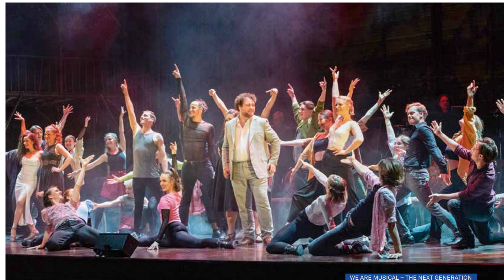
WE ARE MUSICAL – THE NEXT GENERATION