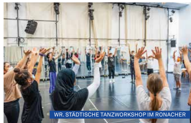
WR. STÄDTISCHE TANZWORKSHOP IM RONACHER

Interaktive Workshops finden direkt an Schulen zur Einstimmung auf das Musical oder als Nachbereitung zum Showbesuch von CATS und REBECCA statt. An der NMS Gassergasse verwirklichte VBW JUNGES MUSICAL mit dem 4. Jahrgang ein viertägiges Projekt zu MISS SAIGON, in dem Konfliktlösung und Kommunikation im Mittelpunkt standen. Dabei wurden klassische Rollenbilder analysiert und hinterfragt sowie der eigene Handlungshorizont erweitert.