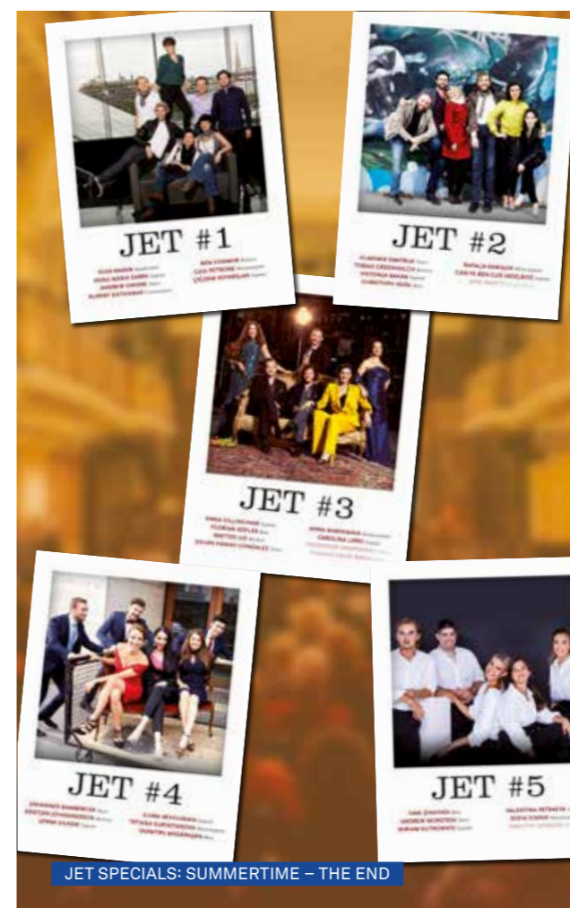
JET SPECIALS: SUMMERTIME – THE END