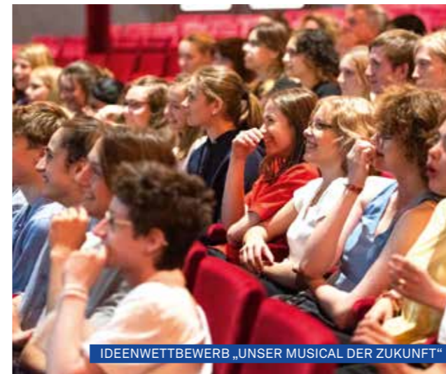
IDEENWETTBEWERB „UNSER MUSICAL DER ZUKUNFT“