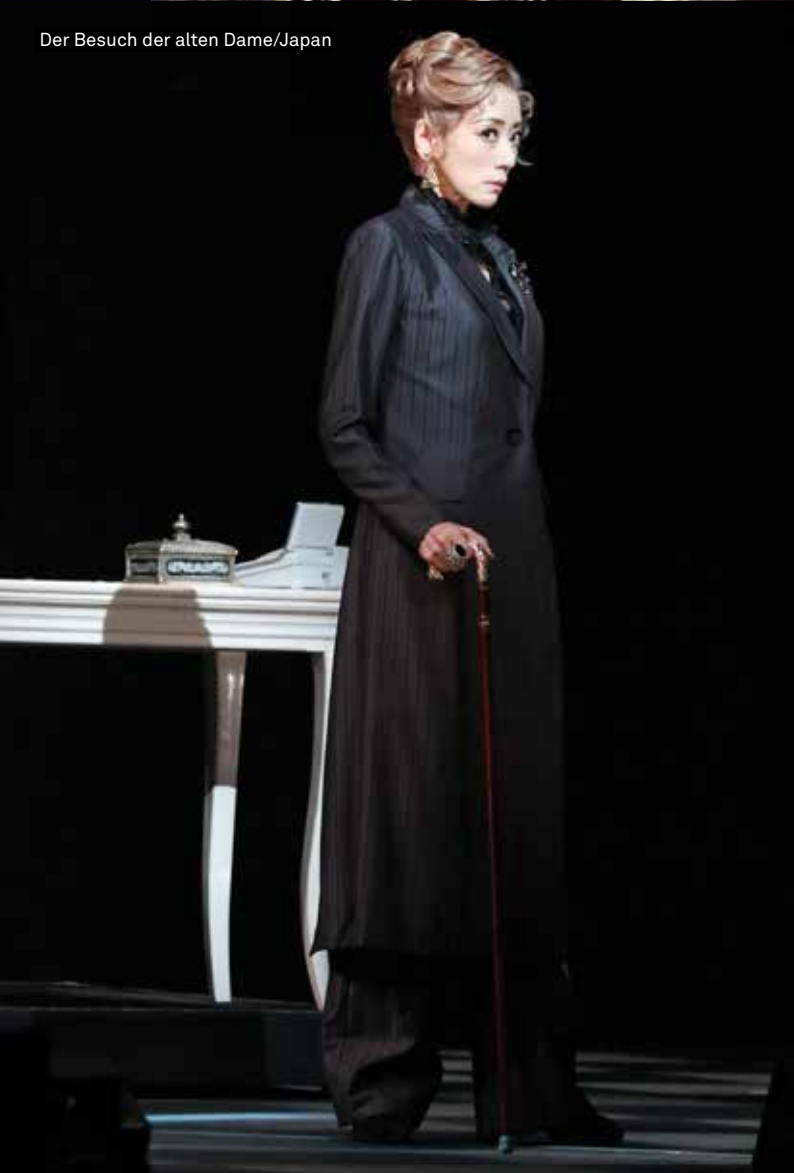
Der Besuch der alten Dame/Japan