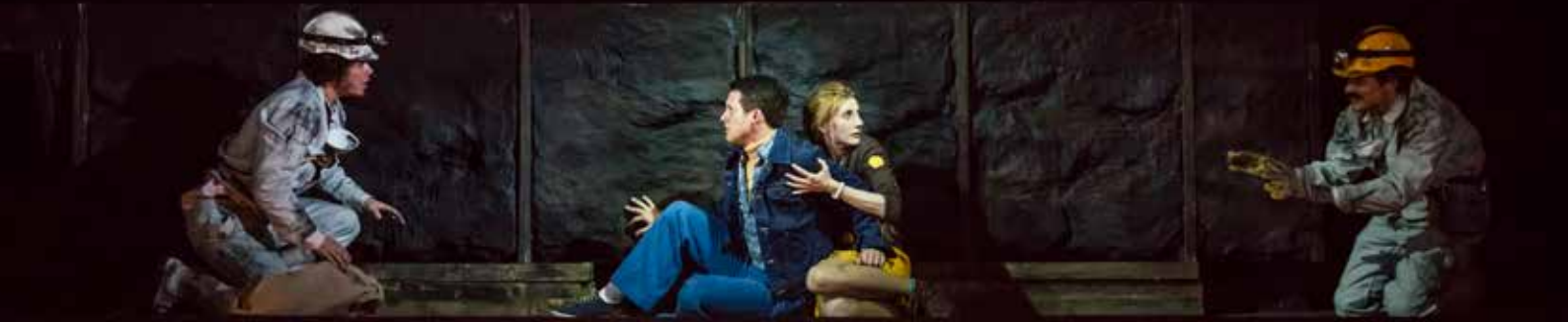
Hänsel und Gretel