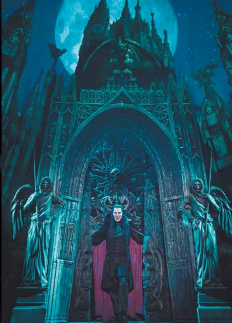
Tanz der Vampire/Moskau/Russland